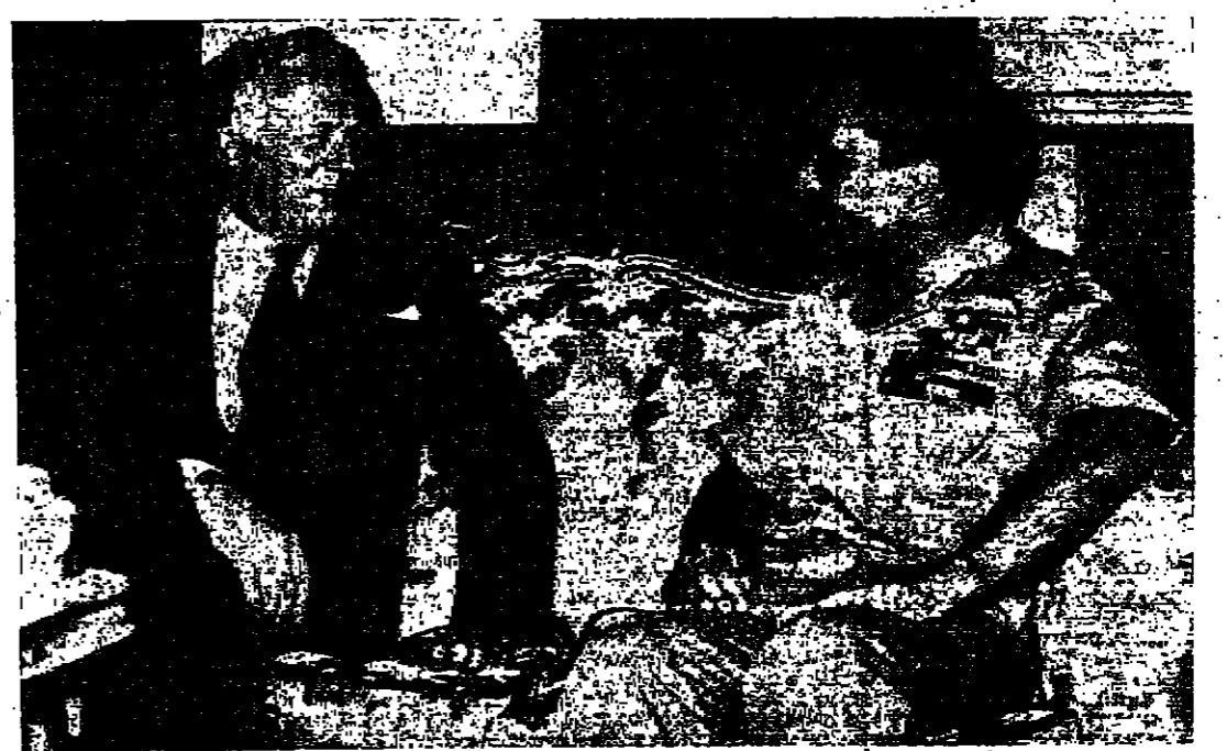
جلالة الملك يتحدث مع السيد جرج بول مندوب الولايات المتحدة لدى الامم المتحدة عندما شرف بمقابلة جلالة بعد ظهر امس